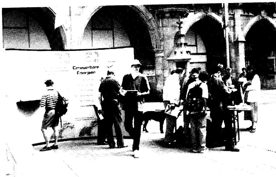
Abb. 1: Info-Stand der Sektion München/Südbayern während eines Etappenhalts der Solarralley „4. Bayern Solar“ auf dem Münchner Marienplatz am 19. Juli

Wer Interesse hat und das Ausstellungssystem ausleihen will: Einfach bei der Geschäftsstelle in München anrufen.