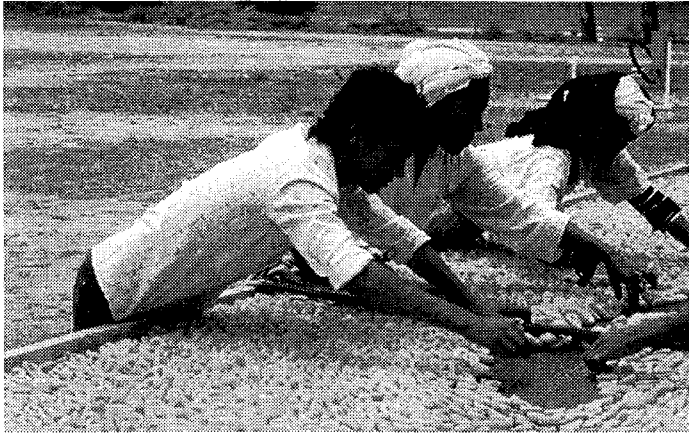
Abb. 3: Trocknung von Aprikosen in Marokko

trocknende Produkt bestimmt. Bei Obst wie z. B. Aprikosen oder Mangofrüchten, die meist in geschnittener Form getrocknet werden, liegt die Füllmenge bei ca. 250 kg, bei Produkten wie z. B. Trauben oder Feigen mit einer hohen Belegdichte von bis zu 25 kg/m 2 kann bei der Trocknerfläche von 20 m 2 ein Fassungsvermögen von bis zu 500 kg erreicht werden. In Regionen mit hoher Einstrahlung, wie beispielsweise in Marokko oder der Türkei, kann durch Verlängerung des Trockners auf eine Länge von 30 m die Trocknerfläche auf 40 m 2 vergrößert werden, wodurch sich das Fassungsvermögen des solaren Tunnelrockners im Vergleich zur Standardversion verdoppelt.