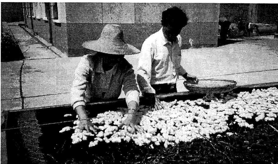
Abb. 4: Gewürztrocknung in China