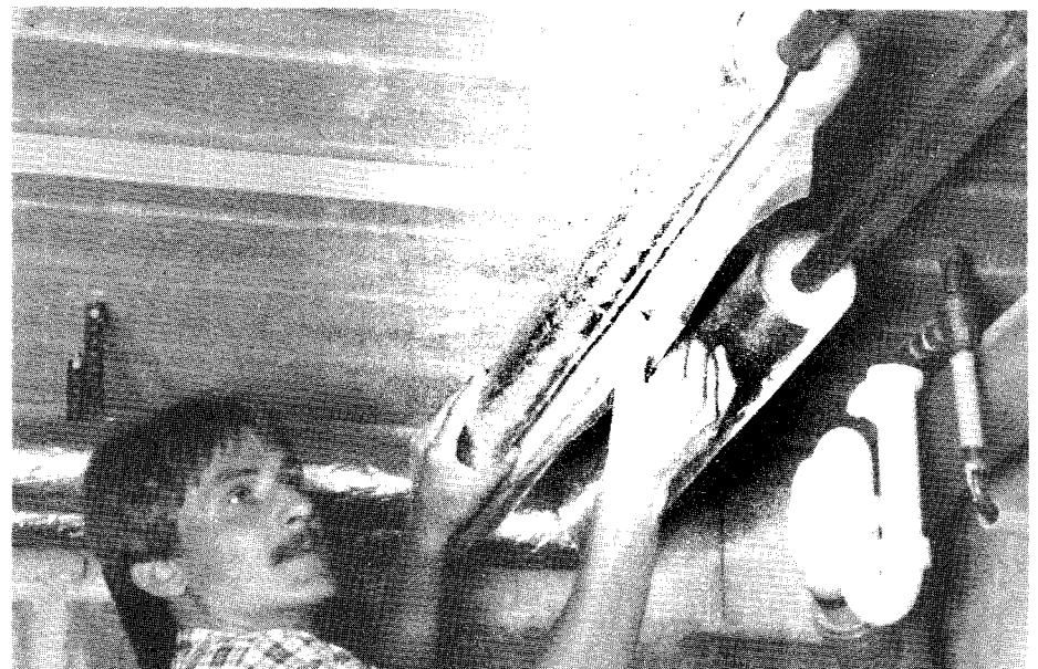
Die Lamellenmatten von G+H sorgen auf einfache Weise für eine hervorragende Wärmedämmung von Rohrleitungen.

Herausgestellt wird ferner, daß die Matten (nach DIN 4102) nicht brennbar sind und Körperschall sowie Rohrleitungsgeräusche erheblich dämpfen. Die Lamellen verrotten und schrumpfen nicht; sie sind mit einer Gitterfolie aus Aluminium ummantelt.