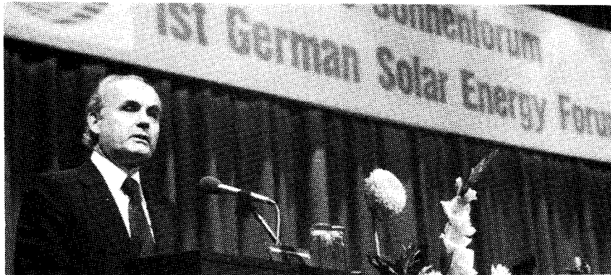
Bundesforschungsminister Matthöfer bei seiner Ansprache

Rede des Bundesministers für Forschung und Technologie, Hans Matthöfer, zur Eröffnung des Ersten Deutschen Sonnenforums am 26. September 1977 im Congress Centrum Hamburg