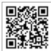
Caterva – Sonnenspezial