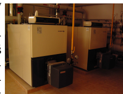
Rys. 2 Kotły systemu grzewczego

W ramach modernizacji systemu grzewczego zainstalowano instalację słoneczną oraz dwa wodne, niskotemperaturowe kotły na propan-butan, o mocy 315 \text{ kW}_{\text{th}} każdy (łącznie 630 \text{ kW}_{\text{th}} ), rys. 2.