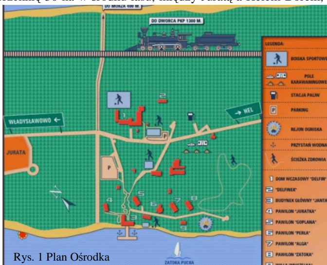
Rys. 1 Plan Ośrodka

gdzie Półwysep ma około 600 m. szerokości. Na terenie ośrodka znajduje się (rys. 1) sześć trzypiętrowych budynków hotelowych, w których może przebywać około 700 gości; ośrodek wyposażony jest w sale konferencyjne; dwie kawiarnie, salę taneczną, bibliotekę; wypożyczalnię sprzętu sportowo-turystycznego i pływającego; fitness klub, korty tenisowe, boiska do gier zespołowych, ścieżkę zdrowia,