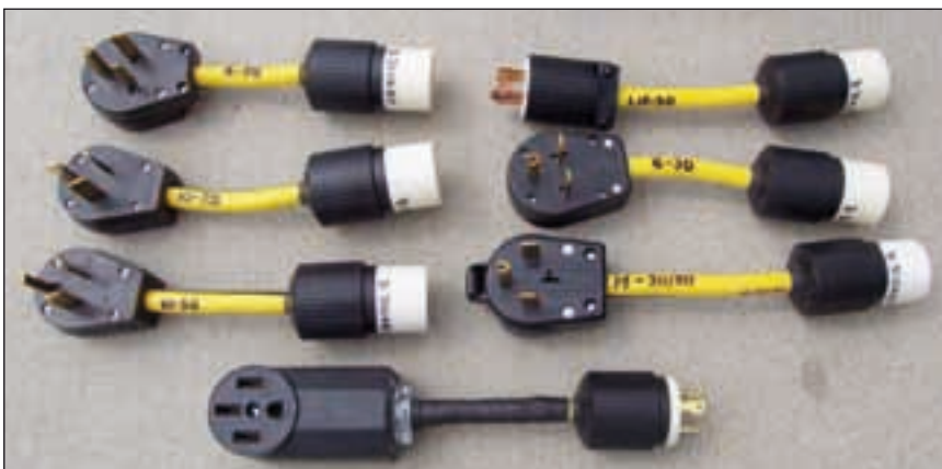
Bild 1 und 2: Der normale Alptraum wird wahr. In den USA gibt es für jede Verkabelung und jede Leistung einen eigenen Stecker. Was als "Sicherheit" gedacht ist, endet in der Praxis im Chaos. Um sein Elektroauto an jede verfügbare Strombuchse anschließen zu können, fahren die Elektromobilisten deshalb meist eine entsprechend vielfältige Sammlung von Adaptern im Kofferraum spazieren. Man weiß ja nie, wo man mal aufladen muss.

Für höhere Leistungen und den rauen Industrieinsatz hat man deshalb schon 1989 eine neue Steckerfamilie definiert. Die Norm ist heute als IEC 60309 bekannt.