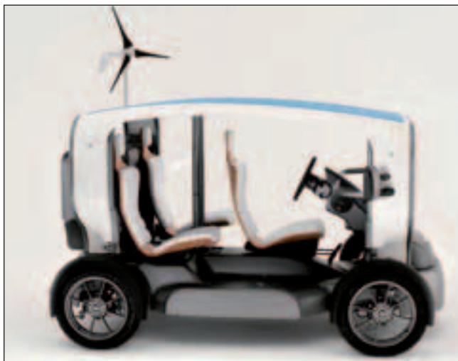
Bild 1: Der Venturi Eclectic hat neben einem Dach aus Solarzellen auch ein optionales Mikrowindrad.