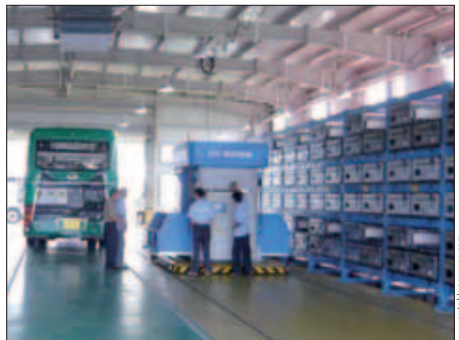
Bild 6: Ein vollautomatisches Wechselbatteriesystem für Omnibusse während der Olympiade 2008 in China.