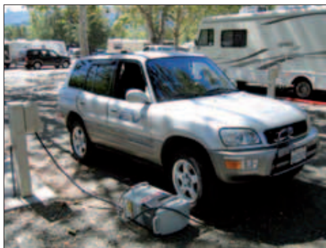
Bild 4: Ein mobiles Induktionsladesystem lädt einen Toyota RAV4-EV auf einem Campingplatz mit Strom aus der Steckdose.