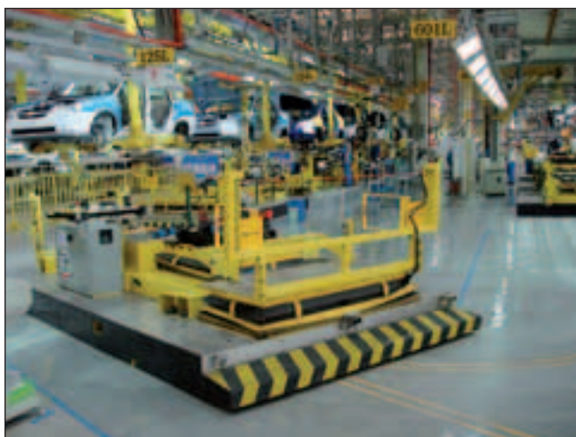
Bild 3: Autonome Industriefahrzeuge werden durch Induktionsschleifen gelenkt und gleichzeitig mit Energie versorgt.

Man kann die Primärspule direkt in den Fahrweg einbauen, womit das System dem einer Oberleitung ähnlich wird. Die