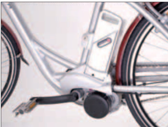
Bild 5: Der Wechselakku eines Pedelecs ist klein, handlich und lässt sich einfach tauschen bzw. zur Ladestation tragen.

Das größte Problem am Wechselakku für PKWs ist die notwendige Standardisierung der physikalischen Abmessungen und Haltevorrichtungen, aber auch von Batteriespannung, der Kommunikation zur Überwachung des Speichers oder Details wie der Anbindung an ein