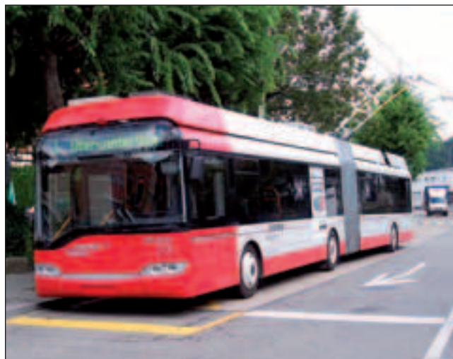
Bild 2: Schleifkontakte im ÖPNV-Einsatz. Ein moderner Oberleitungsbus der Firma Solaris in Winterthur.

schweren Zug von München nach Hamburg zu bewegen ist beim heutigen Wissensstand absolut unmöglich.