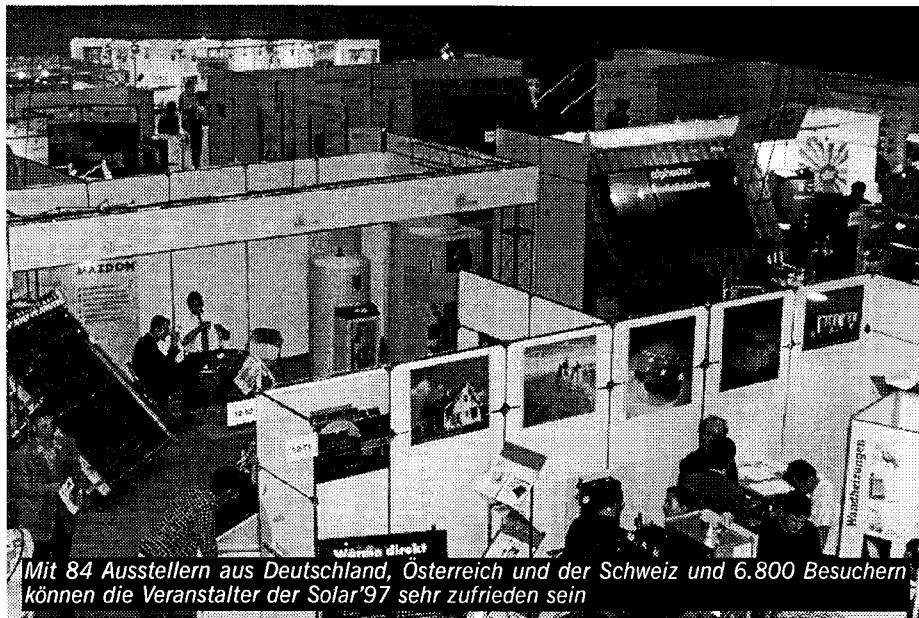
Mit 84 Ausstellern aus Deutschland, Österreich und der Schweiz und 6.800 Besuchern können die Veranstalter der Solar'97 sehr zufrieden sein

Falsche Prioritäten: Solarbranche beklagt Tatenlosigkeit der Politik